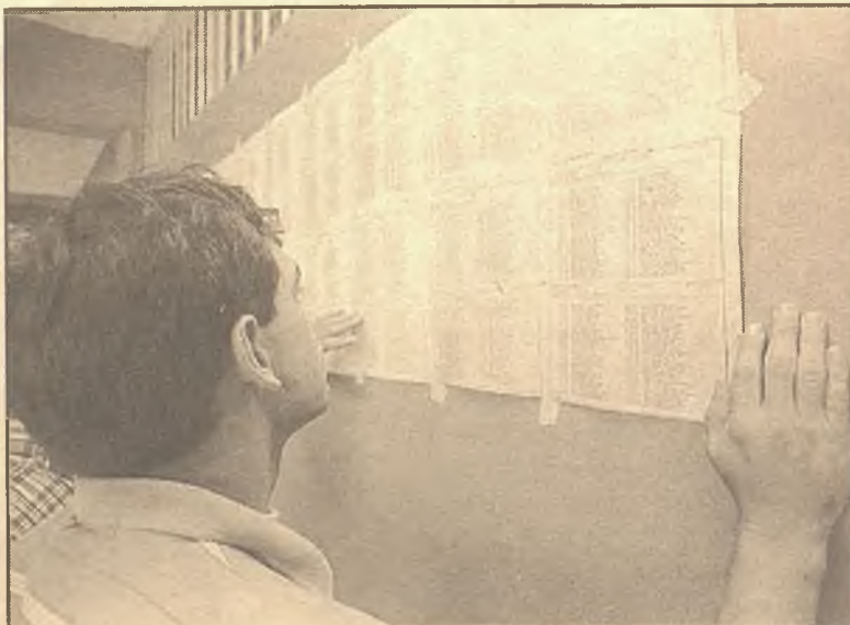
Los venezolanos serán protagonistas de una jornada inédita en el país

► Grupos acreditados como testigos del SI: 15 Grupos acreditados como testigos del NO: 2 Fórmula mixta (SI a la primera, NO a la segunda): 2 YV