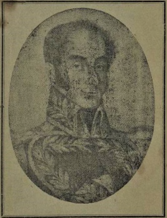
El Libertador Bolívar