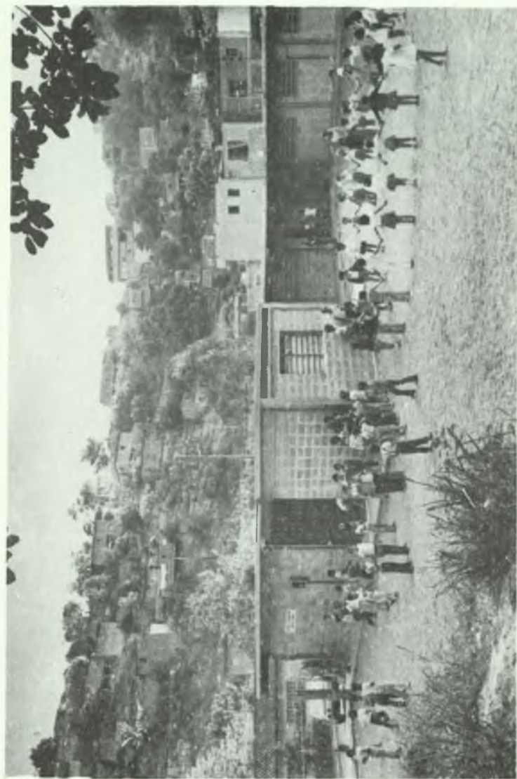
ESCUELA PROMOCION ADOLFO ERNST