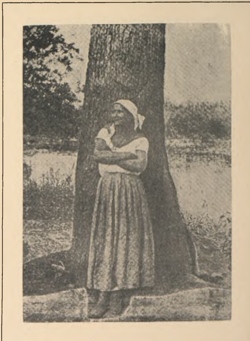
MI CABO (Con la candela para dentro)