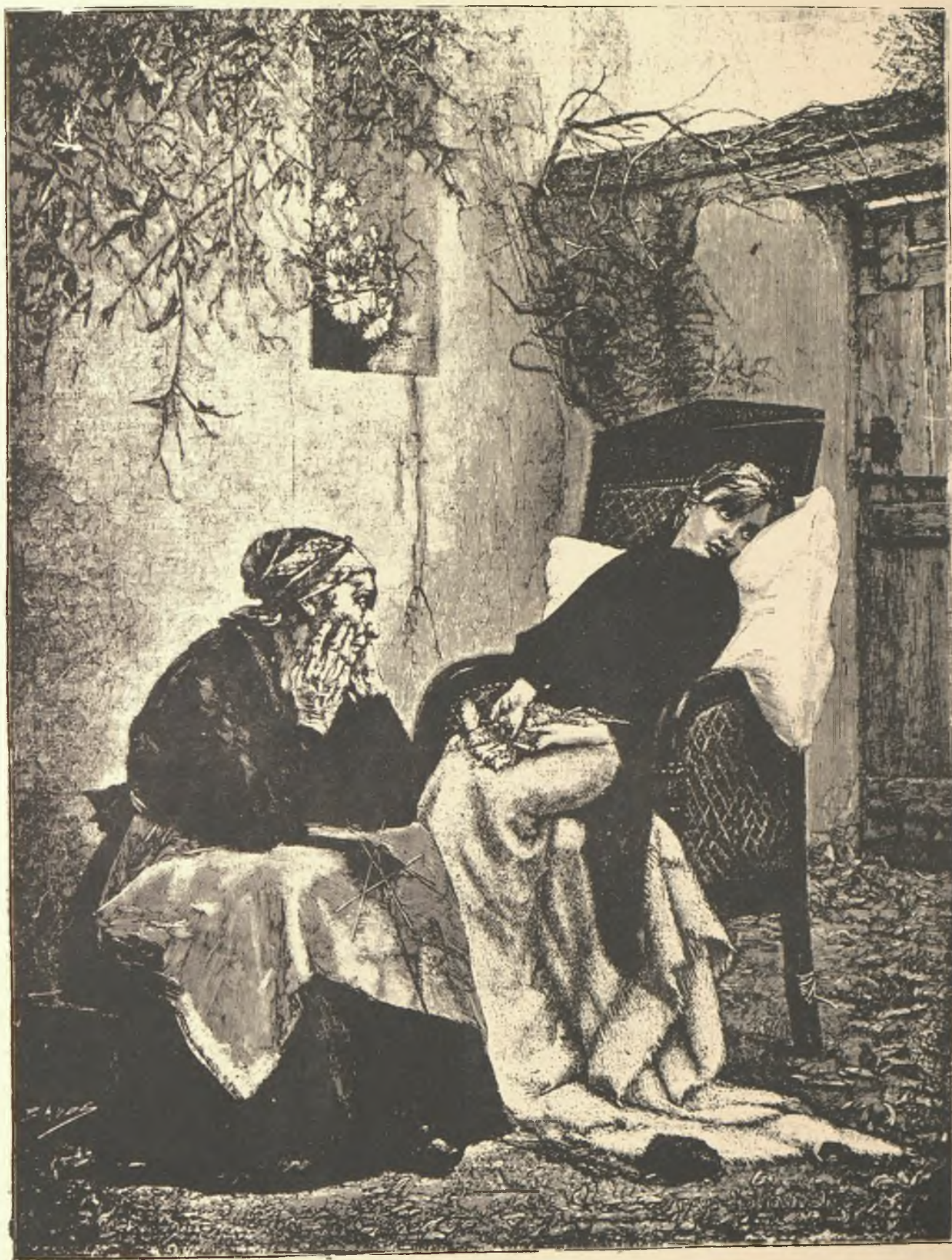
HOJAS DE DICIEMBRE (Cuadro de M. Jenoulet)