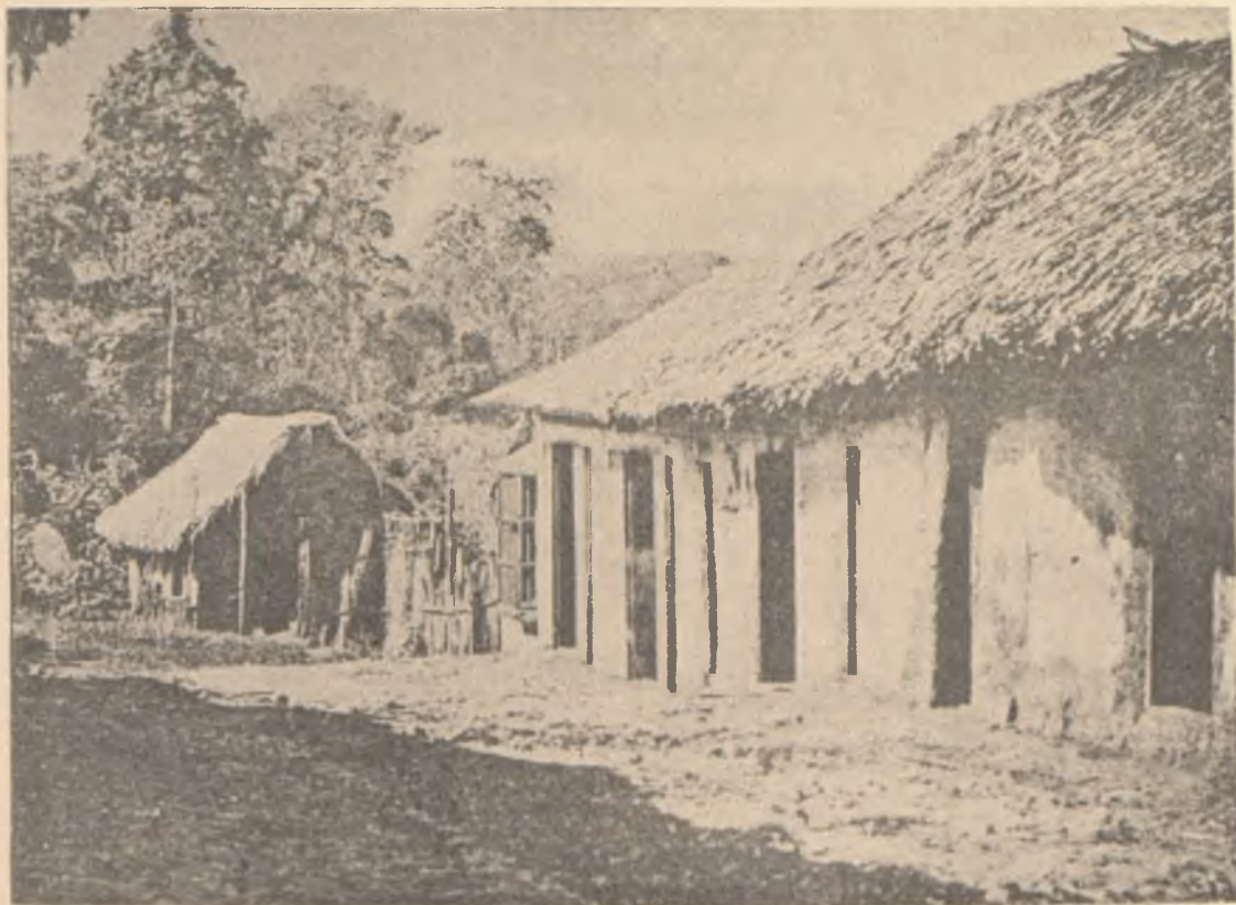
GUAYANA. — CALLE DEL CARATAL