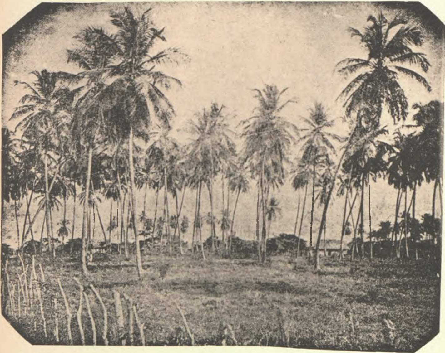
PUERTO CABELLO. — Los Coquitos (Paso Real)