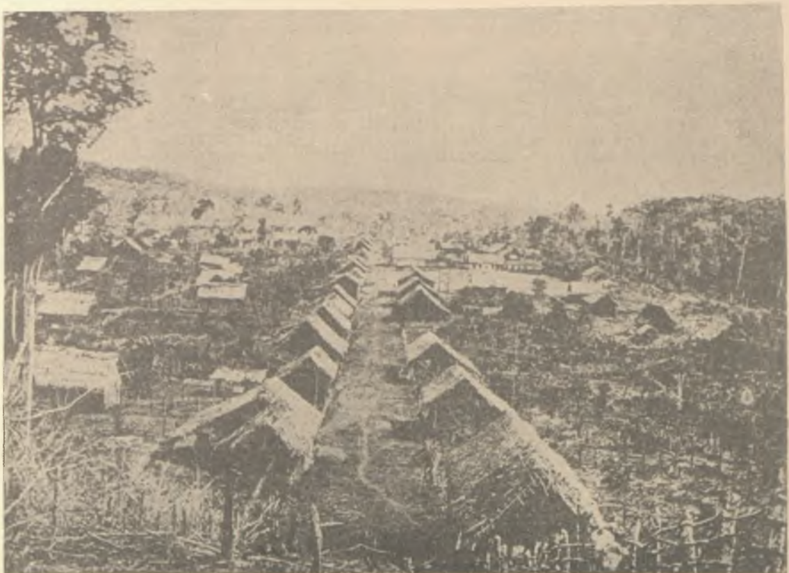
GUAYANA. — VISTA GENERAL DEL CARATAL.