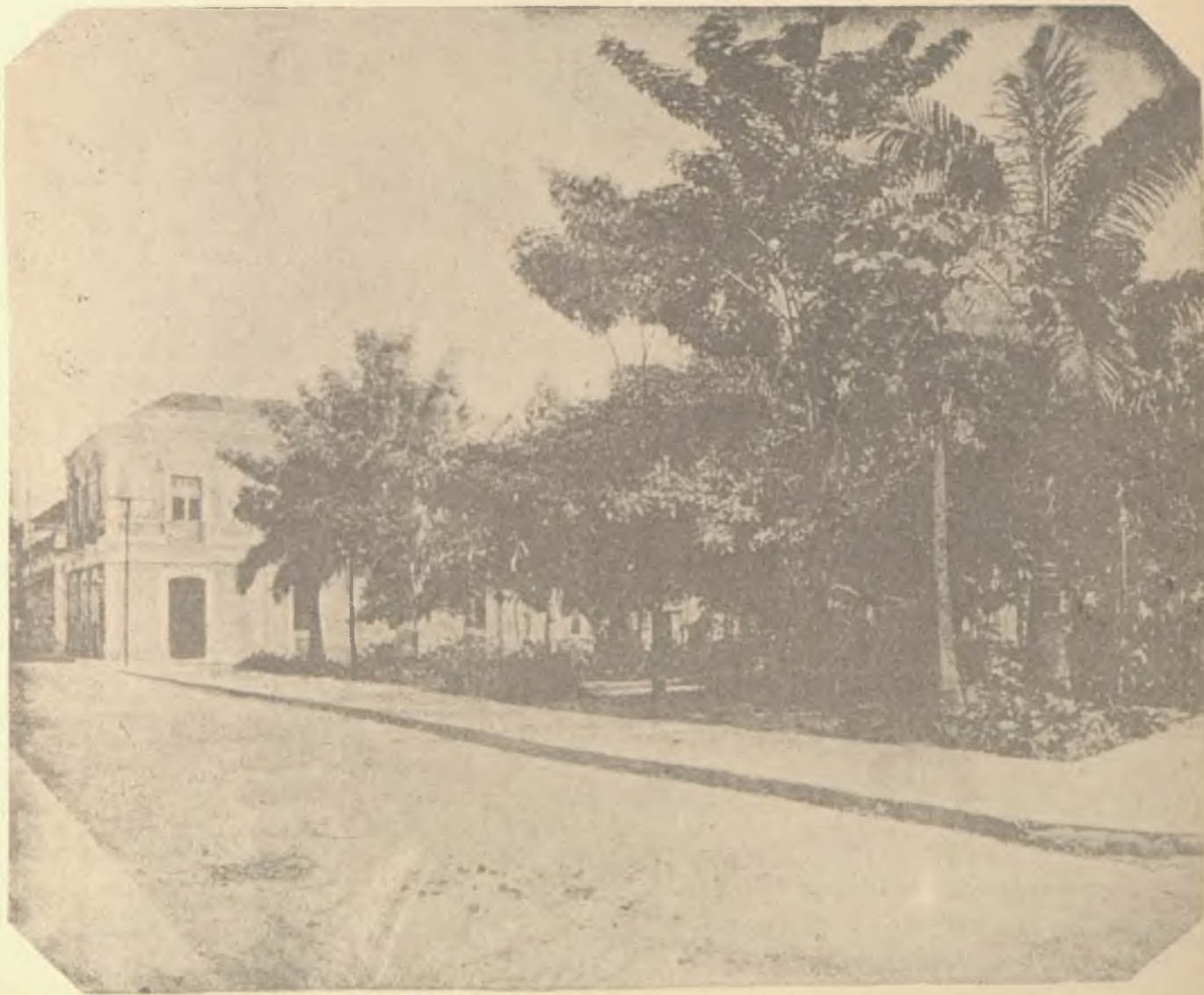
PUERTO CABELLO. — PLAZA SALOM