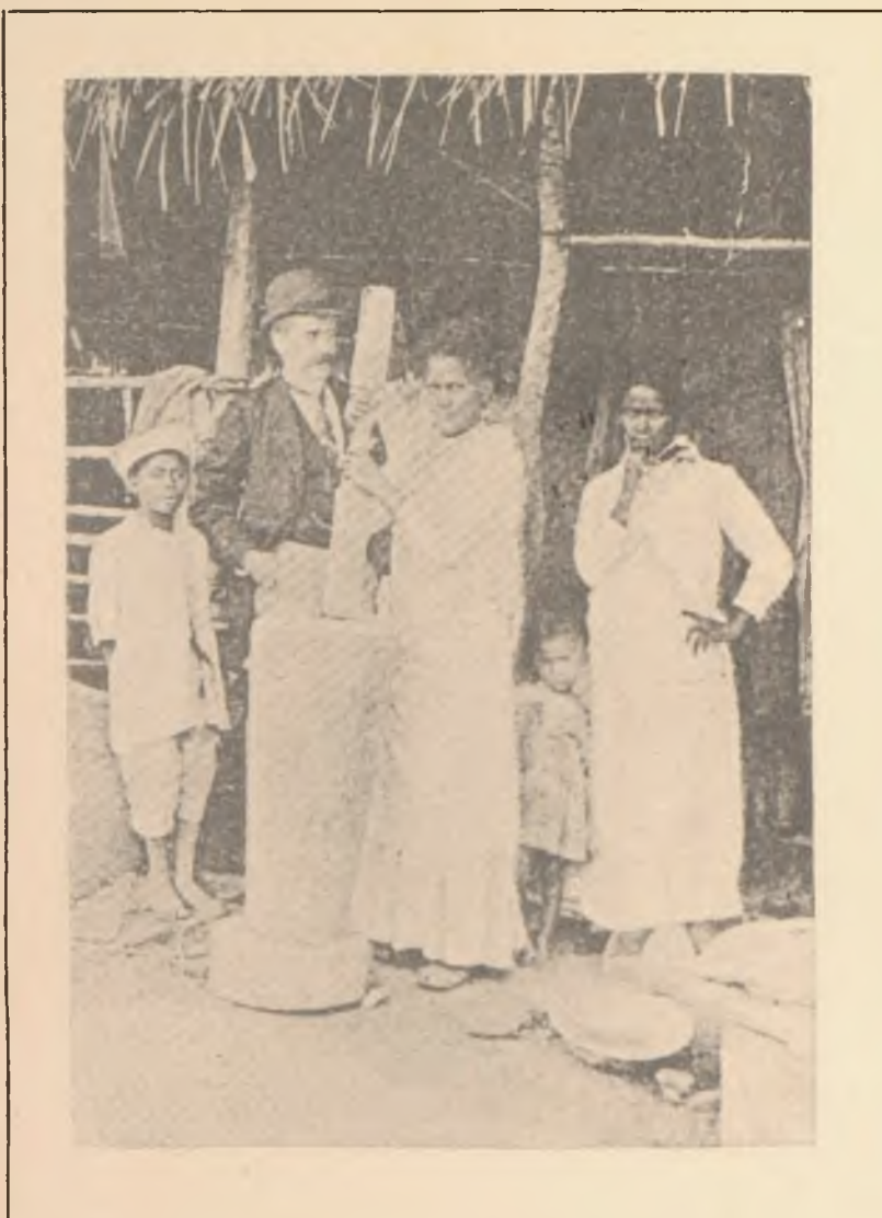
EL PILÓN PRIMITIVO