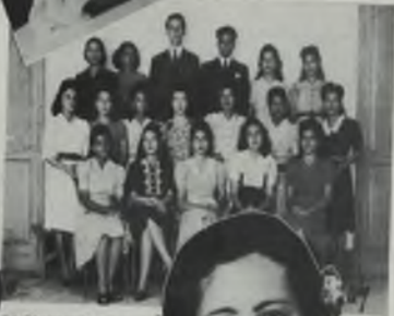
Una fotografía tomada en el "Club Deportivo" de Panamá.