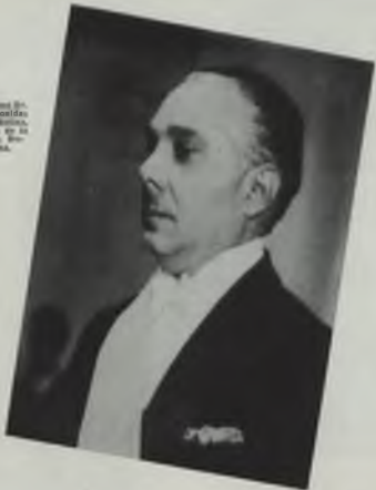
Excmo. Sr. Efraim Leonides Primer Ministro, Presidencia de la República, San Domingo.

En su flora se encuentra una prodigiosa variedad de especímenes que pertenecen a diversas partes de América; y su fauna registra no mismo multitud de especies pro-