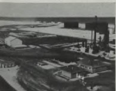
Planta de distribución inicial, y (al fondo) terminal marítimo de la Arabian American Oil Co. en Ras Tanura, Saudi Arabia.

Casi todos los petroleros estarán de acuerdo con el señor Ickes en que la producción del Medio Oriente anterior a la guerra, no ha guardado proporción con las reservas totales, ni con los posibles costos de producción, ni con la accesibilidad de las reservas del Medio Oriente a los mercados europeos. Son muchos los factores responsables del lento desarrollo de estos campos, pero los principales lastres a este desarrollo han sido, indudablemente, consideraciones de índole económica y política. El costo de la búsqueda y producción del petróleo del Medio Oriente, sin con-