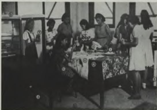
This is a working place in one of our schools. Éste es el puebleto que se usa en una escuela. Ésta es una clase de cocina en una de nuestras escuelas.

1 DOOR puerta PUERTA 3 CUPBOARD armario ARMARIO 2 PLATE SHOVE plancha PLANCHA 4 REFRIGERATOR refrigerador REFRIGERADOR