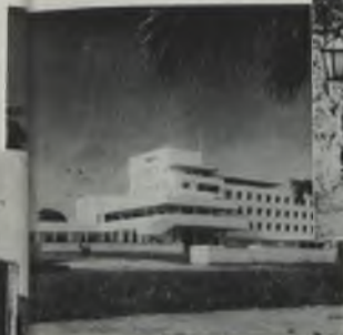
Hotel, ubicado en la Avenida Andrés Bello, Trujillo.