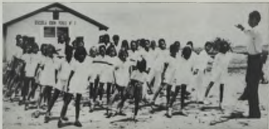
Educación física, en la Escuela "Udón Pérez"-Cronis N° 1, de Temblador, Estado Monagas.