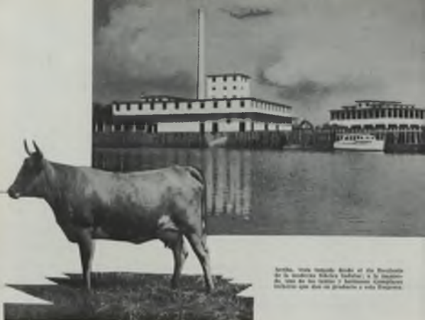
Arriba: Vista tomada desde el río Francisco de la Industria Láctea Nacional, a la izquierda, una de las torres y chimeneas que forman parte del grupo de edificios que dan un carácter a esta Empresa.