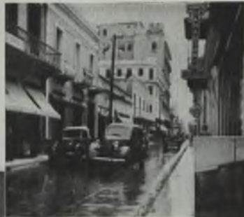
Calle de la ciudad principal de la ciudad. Al fondo, el Palacio y la Iglesia de Santa Bárbara.