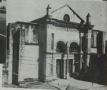
Iglesia de Santa María la Mayor. Fue el primer templo de Trujillo. Desde entonces las iglesias de Trujillo, promueven la cultura.