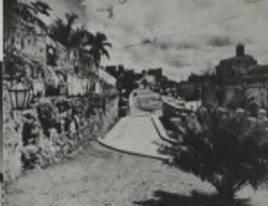
Calle de la ciudad principal de la ciudad. Al fondo, el Palacio y la Iglesia de Santa Bárbara.