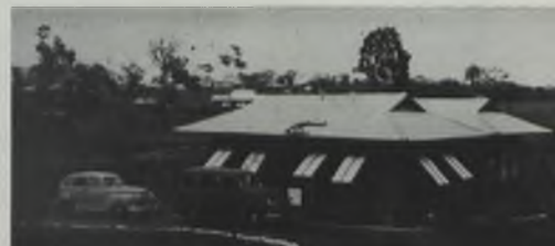
Vista general de la planta, al fondo, el campo de la Compañía.