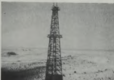
Un pozo de petróleo de la Arabian American Oil Co. en las desiertas planicies de Saudi Arabia.

Este será el reto al que tendrán que prestarle su principal atención los dirigentes de la industria petrolera en Venezuela, una vez que haya terminado la guerra.