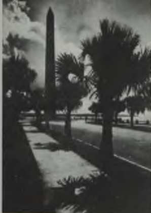
Obelisco que conmemora la independencia de Trujillo. Se levanta como ciudad capital.