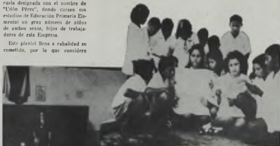
Aquí, un grupo de alumnos leyendo el periódico escolar editado en la Escuela, en la biblioteca, sala de lectura.

dos los requisitos pedagógicos y sanitarios que exige la técnica moderna, estando regentada por un cuerpo de profesionales de la educación perfectamente capacitados.