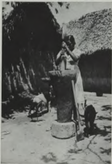
La campesina, al manejar con guetón destreza el "pión", comienza la confección, con el maíz, de unos sabrosos manjares criollos.

En fin, Bello se vale del simil, para otorgarle al maíz, en sentido