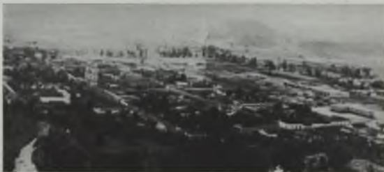
Vista panorámica de la progresista ciudad de Rubio.

Y al hablar de Rubio vaya nuestro sencillo recuerdo para las pulmeras que en un amanecer montañés sembrara en el corazón del pueblo una mano emocionada, y que hoy dan lucimiento, junto a hermosos ejemplares de la flora regional, al Parque donde un viejo árbol, sabedor de historias e impercederas glorias, cedió sitio de honor al bronce imponente y marcial de aquel vencedor de siglos que se llamara Dn. Simón Bolívar.