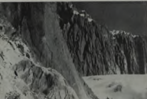
Último campamento de alpinistas antes del ascenso al Pico Bolívar.

Al día siguiente los congelados alpinistas esperan como nunca la aparición del sol con sus benéficos rayos. Después del desayuno parten animadamente nuestros amigos a las 8 a. m. para trepar la Garganta del Espejo y llegar a la Emplanada del mismo nombre. Nos dice Romero: "recomiendo a todo aquel que llegue a este sitio, si está en buenas condiciones, remontar el Pico Espejo pues desde su cima se aprecia un vasto y hermoso panorama; el Pico Bolívar por una "ilusión de montaña" se ve como si distara sólo cien metros de nosotros". Lo interesante de la Emplanada es que allí comienzan las primeras nieves; luego de remontar el Pico Espejo, los Alpinistas regresan a la Emplanada para descender hasta el Glaciar de Timoncito; para llegar allí deben hordear el peligroso "Callejón del Infierno" por su lado Noroeste, sin ver para abajo los que padecen de vértigos y haciendo un alto cada cincuenta metros para tomar aliento. A la 1 p. m. llegan los expedicionarios al Glaciar; hay que acampar y comer algo, aunque a esas alturas el apellido no se presenta y para conservar todas las energías necesarias para la etapa final el alpinista deberá ingerir a la fuerza todo el alimento que pueda.