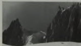
A la izquierda: nieves perpetuas coronan al Pico Bolívar, la cima más alta de Venezuela (5.067 mts) A la derecha: el Glaciar de Timoncito

Muy arriesgadas y varias expediciones han seguido la ruta de estos insignes deportistas, desde que se fundó el Centro Excursionista de Mérida, meritoria institución que ha fomentado el Alpinismo o Andinismo hasta el extremo de crear un interesante torneo Inter-Regional consistente en rescatar de la cima del Bolívar el escudo de los Estados y Territorios de la República que han sido depositados por ellos en la Peña más alta de la cima, en un cofre; todas las entidades federales han sido invitadas por el Centro Excursionista de