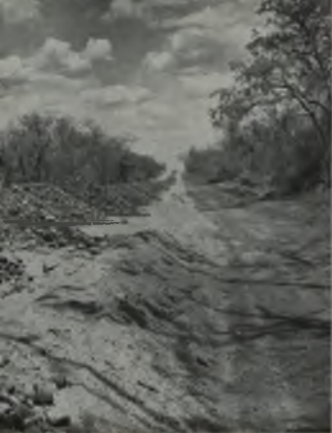
Al lado de la futura carretera, aparece el camino provisional por donde trafica personal y máquinas de construcción.