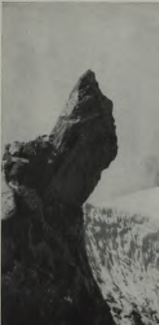
A la derecha, arriba: Vista general de las cimas nevadas y horribles desde el Pico Bolívar. Abajo: Los hermanos regalan la vista del viajero.