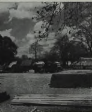
Exposición de materiales de la Creole en Carrizal, Estado Guárico