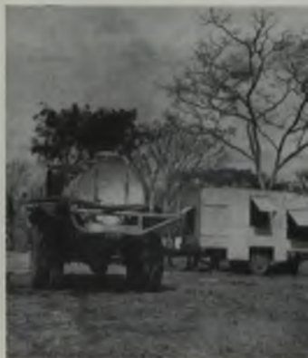
Determinación de las propiedades del barro usado en perforación