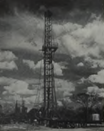
Perforación de primeros pozos exploratorios de la Creole en el Edo. Guárico