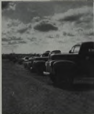
Vehículos de transporte de la Creole en las operaciones del Edo. Guárico

idad, los geólogos de la compañía habían comenzado a trabajar en otras concesiones del Guárico desde 1932. Mas, el estudio detallado de las zonas de Barbacoas y Tamanao fué comenzado únicamente hace unos 18 meses. Las cuadrillas geológicas solían trabajar en el Guárico en medio de grandes dificultades. Los torrenciales aguaceros en pleno invierno, convertían grandes extensiones de terreno en peligrosos tremedales. Los trabajos habían de retrasarse hasta el arribo de la estación de verano.