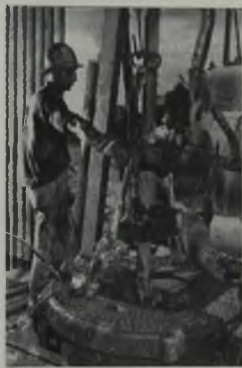
Trabajadores venezolanos en maniobras de perforación (Guárico)