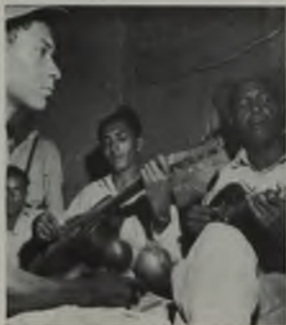
Arriba: Las fiestas del pueblo son animadas siempre por músicos improvisados quienes hacen del joropo una interpretación genuinamente folclórica. Abajo: copia de "La Guacharaca", joropo recogido por el maestro Vicente Emilio Sojo en la población de Guare (Estado Miranda) hace algunos años. Se dice que esta composición data de la época de las guerras de Independencia. Su estructura rítmica la señala como uno de los joropos más típicos, así como su melodía y letra. Aparece publicada en el Primer Cuaderno de Canciones Populares Venezolanas, editado por el Ministerio de Educación Nacional de Venezuela en 1940, y de la cual se hace referencia en el presente artículo.