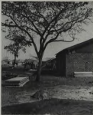
Construcción de casa permanente para trabajadores en Carrizal, Guárico