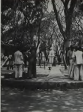
Vista Principal de El Sombrero, Guárico, nuevo centro industrial

en Venezuela. (2) Pero esta proporción se irá haciendo menos favorable al paso que las compañías se vean obligadas a explorar zonas en el país con menos posibilidades geológicas.