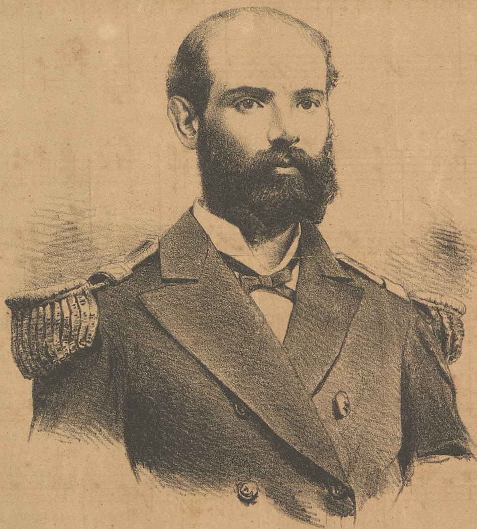
ARTURO PRAT, EL HÉROE DE LA "ESMERALDA".