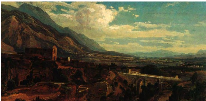
Ruinas del templo de la Santísima Trinidad y puente del mismo epónimo construidos ambos por Juan Domingo del Sacramento Infante. Ferdinand Bellermann.