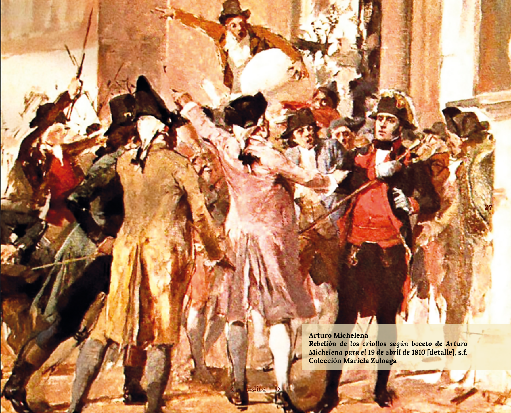
Arturo Michelena Rebelión de los criollos según boceto de Arturo Michelena para el 19 de abril de 1810 [detalle], s.f. Colección Mariela Zuloaga