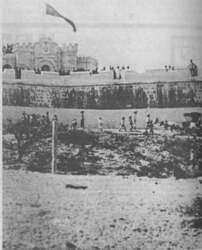
Castillo de Cumaná, 1909.

Durante buena parte de su mandato, Juan Vicente Gómez