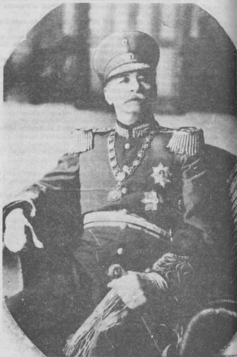
Gral. Juan Vicente Gómez (1857-1935)