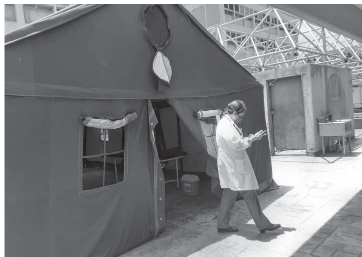
En una carpa atienden en primera instancia a pacientes sospechosos

En este centro de salud también hay una sala de atención para pacientes con problemas leves de respiración, dotada con nebulizadores, equipos de radiología, hematologías y pruebas rápidas para el diagnóstico del coronavirus.