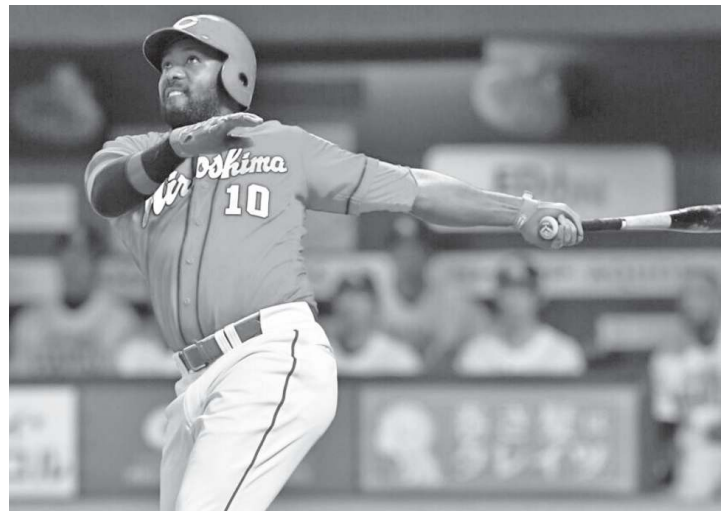
El zuliano dio otro par de sencillos en la jornada inaugural.

López afronta su octava campaña en Japón y la que será la sexta con las Estrellas de Dena. El rendimiento del primera base desde su aterrizaje en la nación asiática ha sido sumamente bueno. Solo en su prime-