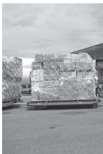
El material se recibió en La Guaira

Resaltó la solidaridad que está promoviendo Naciones Unidas en estos momentos de pandemia. Además, Arreaza señaló que en este envío llegaron