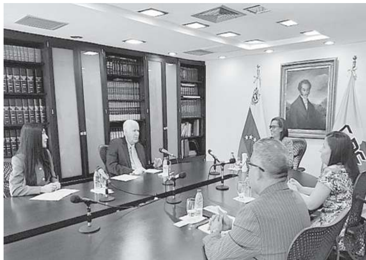
La información la dio a conocer el ente comicial por twitter

“La Comisión de Participación Política y Financiamiento se instaló presidida por el vi-