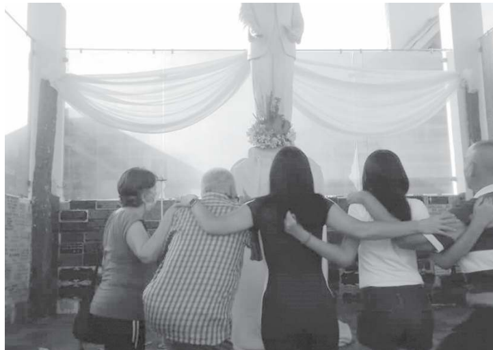
Los trujillanos celebraron con emoción la declaratoria de su paisano