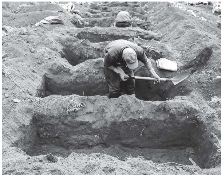
Brasil es el segundo país del mundo con más muertes por covid-19.

Sin embargo la mayoría de los gobiernos regionales y municipales del país dio inicio a procesos graduales de desescalada de las medidas de distanciamiento