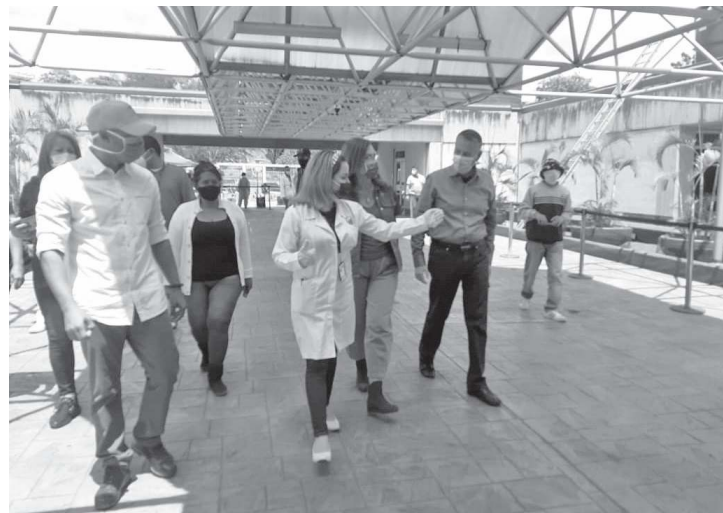
Autoridades inspeccionan los espacios del hospital

En el área del piso dos crearon un triaje especial para la evaluación del sistema respiratorio. Allí los pacientes con síntomas de problemas respiratorios, quienes son atendidos por especialistas en medicina interna, endocrinos y otorrinolaringólogos.