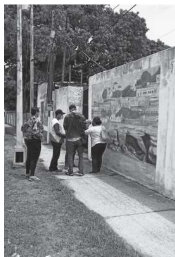
Inspeccionan los murales. IM

Nazoa fue un multifacético y humilde intelectual, del cual se recuerda siempre su frase "las cosas más sencillas". ●