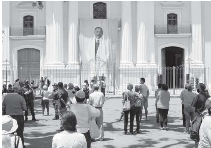
La gente se apostó en las afueras de la iglesia de La Candelaria. M. BATISTA