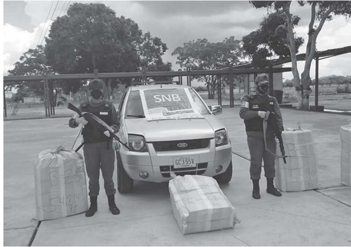
Retuvieron dos vehículos donde transportaban el alijo.

Según la GNB “el estado Anzóategui se ubica como la segunda entidad con las mayores incautaciones de drogas del