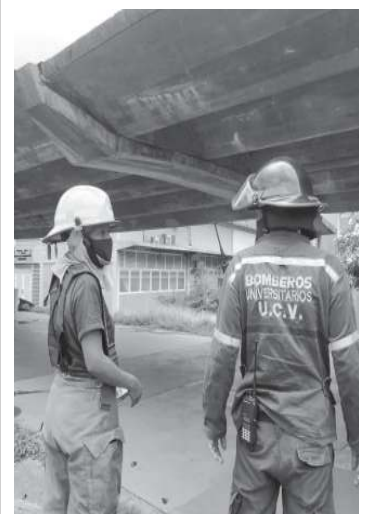
Bomberos en la inspección.

Se precisó en el informe técnico que se tiene previsto realizar el restablecimiento de la capacidad estructural, con la reversión de las deformaciones elásticas presentes en vigas y losas, la restauración de los elementos afectados por patologías vinculadas a las mermas estructurales, entre otras acciones externas, vinculadas a la pérdida de elementos o partes por el desgaste del tiempo, para así restaurar el patrimonio de la Ciudad Universitaria sin modificar la edificación original. ●