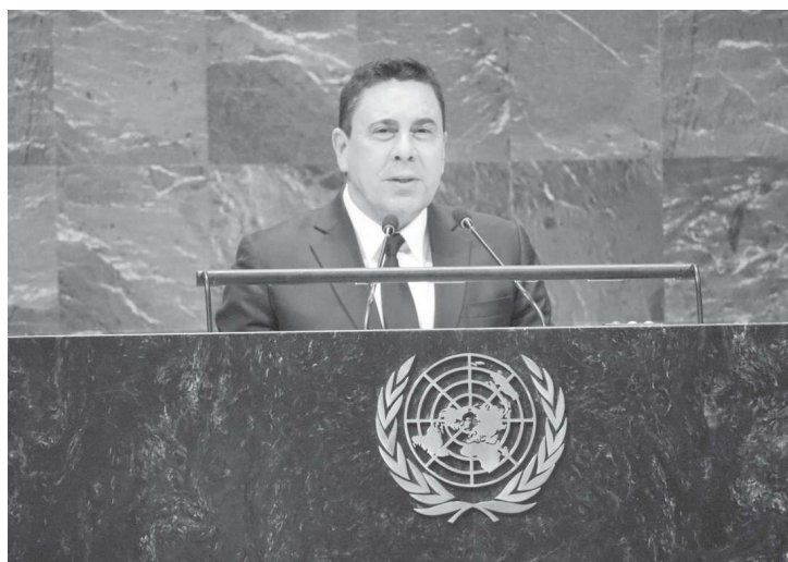
Moncada citó lo descrito en el libro La habitación donde sucedió

Entre otros asuntos escabrosos, Bolton asegura en su libro que el escándalo de Ucrania,