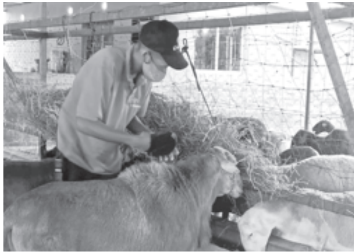
Agropecuaria El Triunfo, en Tamaca, estado Lara.

Regiones en acción. Maduro aprovechó, mediante varios pases televisivos, para mostrar los avances en el sector agropecuario. Desde el sector Petquire, parroquia Carayaca, del