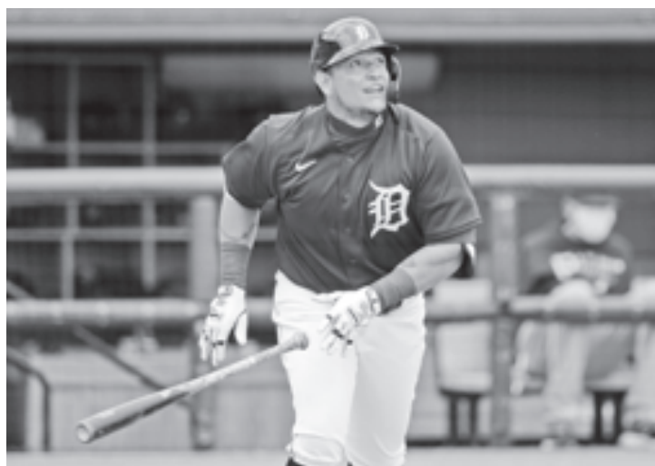
Se entrena para un año que puede asegurar su placa en Cooperstown.

ra ligó de 4-1 con par de ponches y una anotada para dejar promedio de .225.