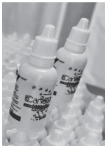
El antiviral se suministra en gotas.