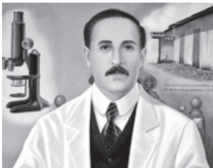
La celebración litúrgica del médico será cada 26 de octubre.

El cardenal Porras declaró que “la beatificación llega en un momento particularmente oportuno”, haciendo referencia a la pandemia por covid-19, por tal motivo manifestó que existe la probabilidad de que la actividad litúrgica se lleve a cabo sin mucho público presente y solo con un pequeño grupo de religiosos, se evalúa la posibilidad de que el evento sea