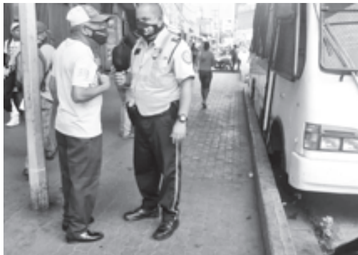
Polisucra realiza recorridos para verificar el cumplimiento de medidas.

“Después que cumplimos un año con la emergencia sanitaria que ha ocasionado la pandemia del covid-19, conociendo todos los problemas que la enfermedad ha traído a nivel mundial, todavía tenemos personas irresponsables que se niegan a utilizar correctamente el tapabocas, poniendo en riesgo su vida y la de los demás,