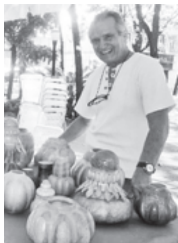
Artisanos preparan propuestas.

La II edición del Concurso Nacional de Artesanía, que rinde homenaje a Rafaela Baroni, premiará a los artistas en las categorías ancestral indígena, ancestral afrodescendiente, tradicional popular, contemporánea, eco artesanía, artesanía lúdica, identidad cultural y aprendizaje artesano. El anuncio se hará el próximo 17 de junio y se hará una muestra virtual de las obras ganadoras en las redes sociales. ● VAR