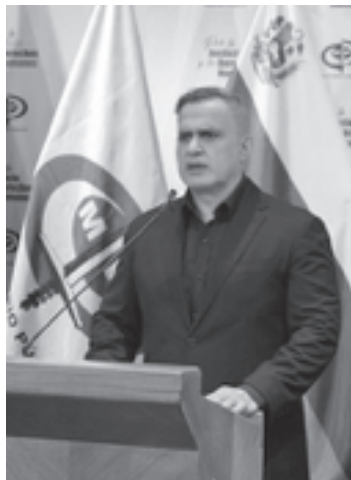
Fiscal general Tarek William Saab.

El fiscal aprovechó para anunciar también la creación de una nueva fiscalía nacional especializada para la investigación de delitos de femicidio, a propósito de que se está “en una cruzada sin cuartel en contra de los femicidas”. Dijo en la rueda de prensa que hoy abordará en detalles sobre la creación de estas instancias en la que rendirá un balance en acciones emprendidas contra criminales, condenas recientes y casos emblemáticos que han merecido todo el peso de la justicia. ● EA