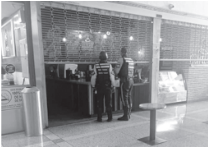
Cuerpos de seguridad bajan la santamaría a locales no priorizados.

Ratificó los horarios de circulación para esta cuarentena radical de 8 de la mañana a 9 de la noche, sólo para gestiones de salud y alimentos. Los restaurantes solo trabajarán a domicilio o recibirán severas sanciones. ●