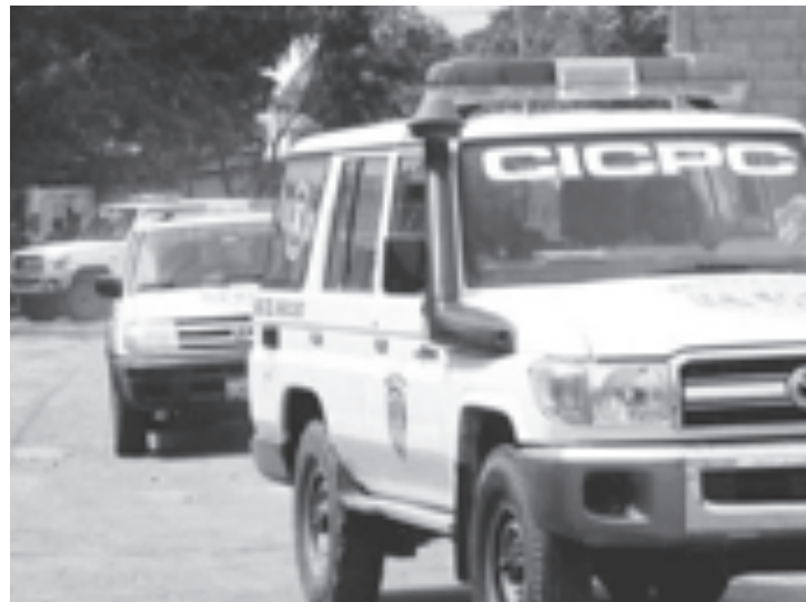
La policía científica realizó el procedimiento.