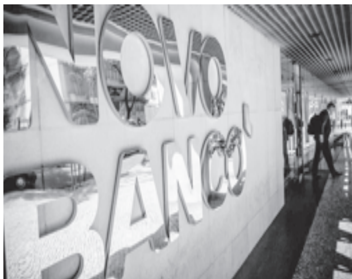
El Gobierno envió cartas a entidades financieras sin obtener resultados.

Puntualizó que, desde marzo de 2020, cuando se decretó la pandemia por covid-19 en nuestro país, el Gobierno nacional ha enviado, sin éxito alguno,