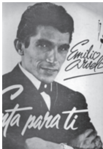
Hasta el 28 de mayo.

Así nació el Cumpleaños feliz ; grabado por el trío Los Latinos, hasta la llegada de Emilio Arvelo, quien le dio un toque personal con su voz y la convirtió en la más entonada de los hogares del país; con características de "Himno tradicional" que hoy forma parte de la identidad nacional. ●