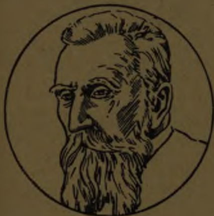
Raza blanca o caucásica.

Las razas humanas .—El hombre se halla distribuido por todas partes del globo; aunque todos constituyen la especie humana, existen distintos grupos que se diferencian entre sí por distintas causas; estos grupos forman lo que se llama las razas humanas . Estas se dividen en cinco que toman el nombre característico del color de su piel: la blanca , amarilla , negra , malaya y cobriza .