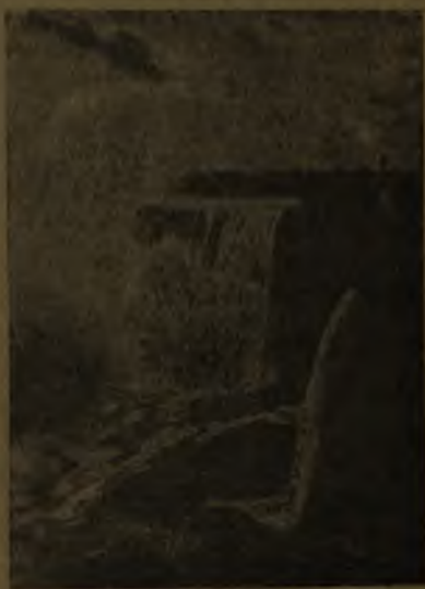
Vista de las cataratas del Niágara

dental, o del lado oeste, formada en América del Norte, por los Montes de Alaska , en los cuales se halla el pico más alto de América del Norte, llamado Mac-Kinley , que alcanza una altura de 6.239 metros, luego, siempre de norte a sur, siguen los Montes Rocallosos , o Montañas Rocosas, que alcanzan también grandes alturas, como el pico Blanca Pesk, de cerca de 5.000 metros; estas cadenas se prolongan hasta alcanzar la frontera de México, formando la Sierra Blanca , y penetrando en Méjico toma el nombre de Sierra Madre . Esta gran cordillera del oeste se continúa en la América Central, siguiendo sus ramales hacia el sur, hasta que ya en Colombia comienza la gran cadena de la Cordillera de los Andes que se prolonga hasta el sur de la América del Sur. El macizo andino alcanza su máxima altura en el pico Aconcagua , de una altura de 7.142 metros; otros picos de gran altura se levantan en América del Sur, como el Chimborazo, Ambato, Mercedario, etc. Muchos de estos picos son volcánicos como el Tupungato, Descabe-