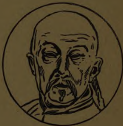
Raza amarilla o mongólica.

La raza blanca es la más numerosa de la tierra y los pueblos constituidos por individuos de esta raza son considerados los más civilizados, contándose entre ellos en primer término toda la Europa en general. Habitadas en su gran mayoría por blancos también, dignas de mencionar son las Américas, que han alcanzado en relativamente pocos años un grado espléndido de adelanto material y espiritual.