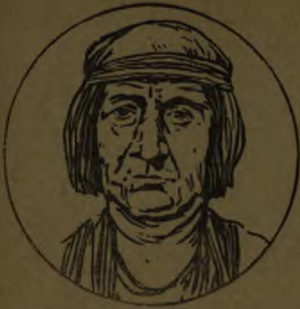
Raza cobriza o americana.

gunas regiones de las tres Américas viven aún representantes de esta raza cobriza, cuyos individuos fueron los primitivos pobladores de este continente. La raza cobriza o pardo rojiza se caracteriza por ser en general de talla más bien alta, tener el cabello negro y lacio y la nariz grande y aguileña. Las principales agrupaciones de la América del Norte y Central fueron los pieles rojas, aztecas y mayas; en América del Sur, quichúas, guajiros, caribes, araucanos, etc.