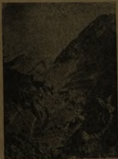
Vista del Aconcagua, pico culminante de la cordillera andina

Aspecto general de las tres Américas. Su situación. —El continente americano, o América, está situado en el hemisferio occidental; en su larga extensión divide el Océano Pacífico y el Atlántico, interponiéndose entre ambos como una mole gigantesca. Tres son las Américas, y físicamente son también tres las porciones que las caracterizan; América del Norte , América Central , que viene a