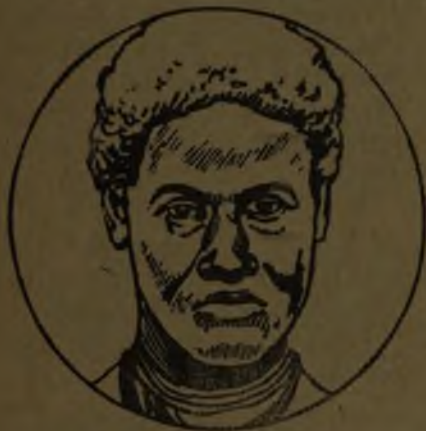
Raza negra o africana.

Entre los seres que forman esta raza hay diversos tipos como el cafre, por ejemplo, que son de estatura más bien alta, y los de pequeña talla, los negritos del centro de Africa, etc.