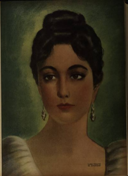
Luisa Cáceres de Arismendi