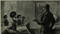
El "Día del Maestro" se celebra en Venezuela cada año el día 15 de septiembre. Este día se celebra al maestro de la escuela venezolana don Andrés Bello, que durante largos años ha sido el fundador de la escuela.