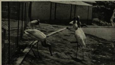
Una de las aves que tienen más la similitud del color que se venía por las listas (prothorax) es el "busto" (prothorax), que se ve por las listas. Tiene el pecho color crema claro. Tiene el pecho color crema claro.